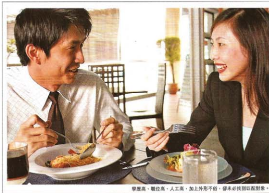
學歷高、職位高、人工高，加上外形不俗，卻未必找到靚對象。